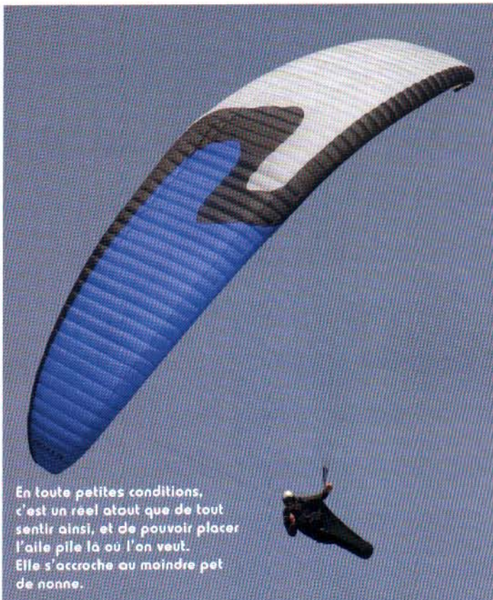
En toute petites conditions, c'est un réel atout que de tout sentir ainsi, et de pouvoir placer l'aile pile là où l'on veut. Elle s'accroche au moindre pet de nonne.

De fait, avec ce calage performant, l'Antea glisse, avance sans rechigner et mord dans l'ascendance. L'utilisation de l'accélérateur, sur le premier tiers de sa course, dégrade peu la finesse et permet de voler à plus de 45 km/h sereinement, stablement. En thermique, l'Antea se place idéalement et s'incline avec une coordination évidente à comprendre. Les petites corrections se font à la sellette, et l'aile obéit au doigt et à l'œil. Au doigt ? grâce à une poignée très astucieuse qui arrive à combiner légèreté, souplesse et confort : une toute petite barre, prolongeant la partie haute de la poignée, permet de choisir le contact avec la ligne de frein. Plus que malin et surtout aucun effet de poids contrairement aux barres métalliques ou plastiques rapportées, qui s'emmêlent volontiers au gonflage ! La communication de l'aile est excellente, présente dès le point de contact à la commande. En toute petites conditions, c'est un réel atout que de tout sentir ainsi, et de pouvoir placer l'aile pile là où l'on veut. De fait, l'Antea est remarquablement efficace en petites conditions, s'accrochant au moindre pet de